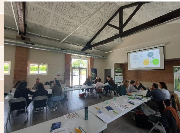
Journée technique : Florilèges Propage – Saint Orens de Gameville (31) – mai 2024