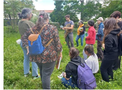
Journée technique : Florilèges Propage – Saint Orens de Gameville (31) – mai 2024